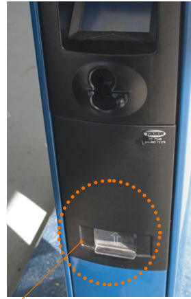
Entrega de recibo