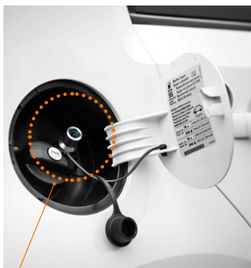
Toma de carga del vehículo