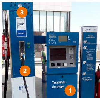
Estación sin cierre