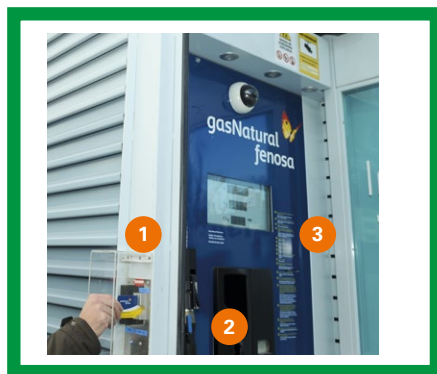
Estación con cierre