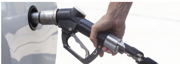
Manguera tipo pistola