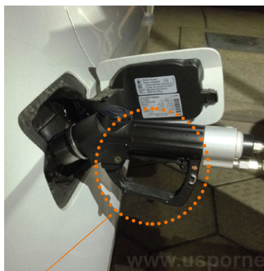
Pistola alineada y gatillo presionado